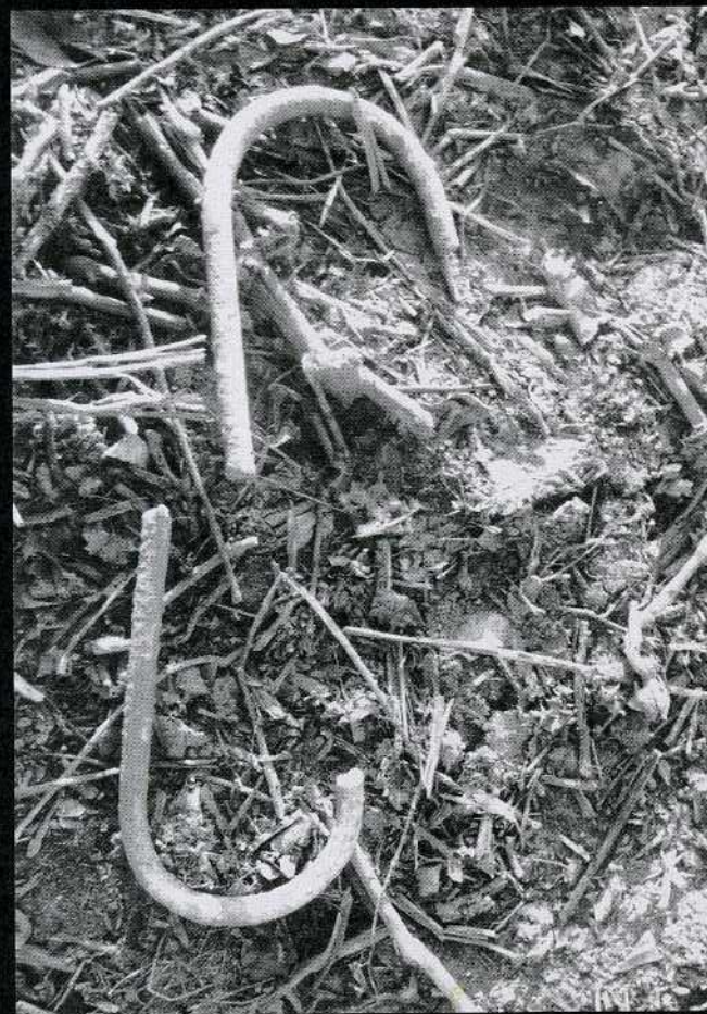
Jeroen van Westen - Leesteken Vinexlocatie Delfgauw

'Schilderen en taal (geschreven of gedrukt) hebben beide een eindeloosheid in zich die voor aarzelende, overwegende, gravende geesten van een afschrikwekkende diepte is. Nooit komt er een einde dat niet meer gewijzigd, verbeterd, gepreciseerd, in een andere verhouding, in meer lagen 'verteld' kan worden. Aan een etsplaat komt een eind, een tekening is op een bepaald punt onleesbaar en ver daarvoor in ieder stadium tot op zekere hoogte af. Het gesproken woord vervliegt, geluid verwaait, fotografie blijft. Ziedaar nog een antwoord dat ik jullie tijdens het gesprek schuldig bleef. Daarom is fotografie zo zwaar; een moment bestaat eeuwig voort. Het is die onverbiddelijke mooimaker (zelfs een gekreukte, door de tijd bruinegevlekte foto laat ons wegzijgen in mijmeringen vol gesnotter) waar Susan Sontag ook over heeft geschreven in het enige boek over fotografie dat werkelijk van belang is. Verder nooit lezen over fotografie, maar kijken, kijken, kijken en als je het lef hebt doen. Ik heb meer lef gekregen, schilder, fotografeer en gebruik taal als beeldverwekker daar waar schilderen, fotograferen zwakker zijn als betekenisdragers ten opzichte van taal als betekenisverlener.'